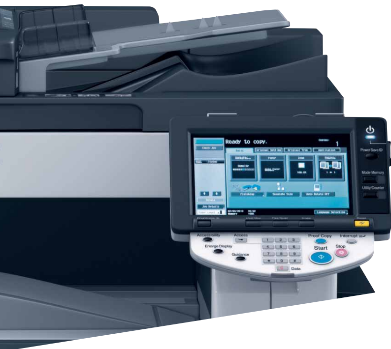
Das leicht bedienbare Farbdisplay der ineo 363

Die hohe Druckqualität in Verbindung mit einer großen Auswahl an Finishing-Funktionen ermöglichen es, selbst höherwertige Dokumente wie Broschüren inhouse zu drucken, zu lochen oder zu heften. Das steigert die Produktivität nachhaltig!