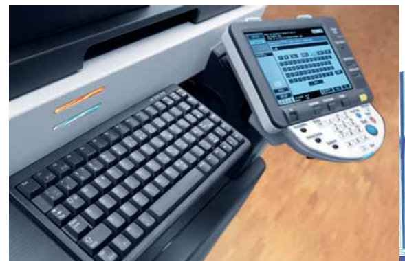
ineo 363 farbiges Touchscreen Display und optionale Tastatur für einfache Eingabe

Profitieren Sie von einem perfekten Team und nutzen Sie die ineo 363 für die Dokumentenproduktion in Schwarzweiß kombiniert mit den ineo+ Systemen für die Erstellung professioneller Farbdokumente.